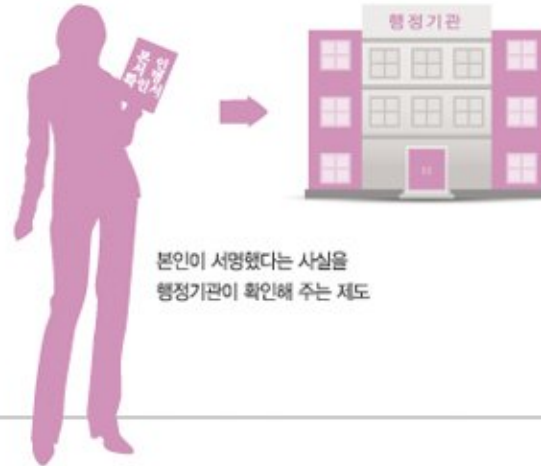
본인이 서명했다는 사실을 행정기관이 확인해 주는 제도

부동산 등기, 금융기관 담보대출, 차량등록 등은 인감증명서 대신 본인서명사실확인서로 대체 가능