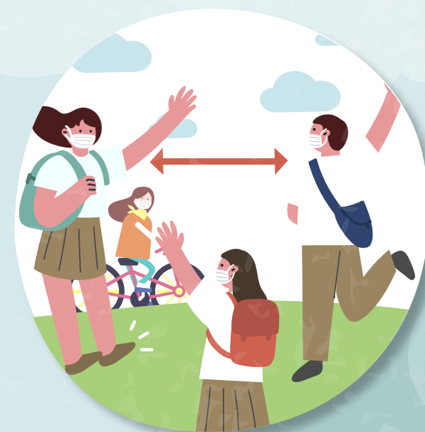
2m 거리두고 도보나 자전거 이용