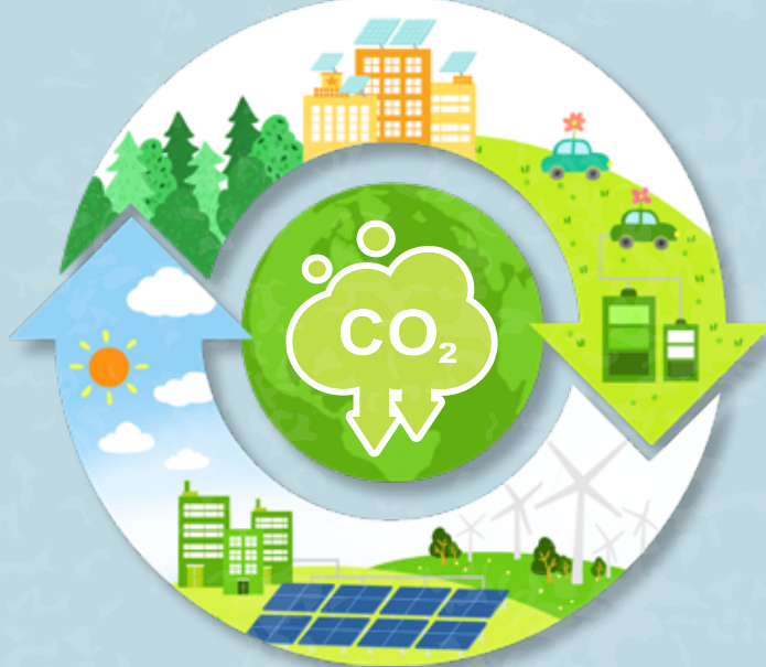
친환경 운전수칙 안내