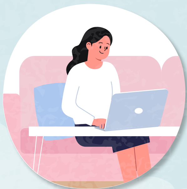
불필요한 외출 자제