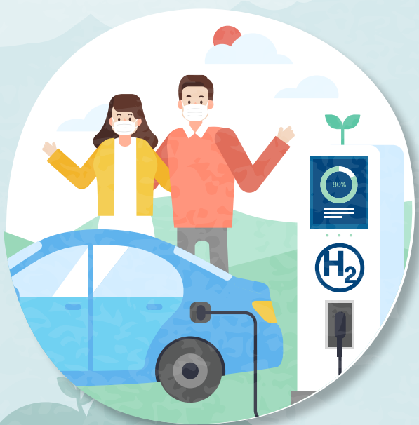
친환경 자동차 이용