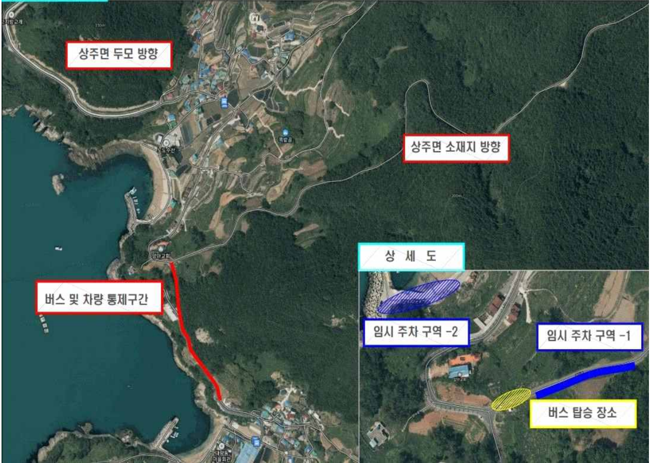
차량 통제 위치도