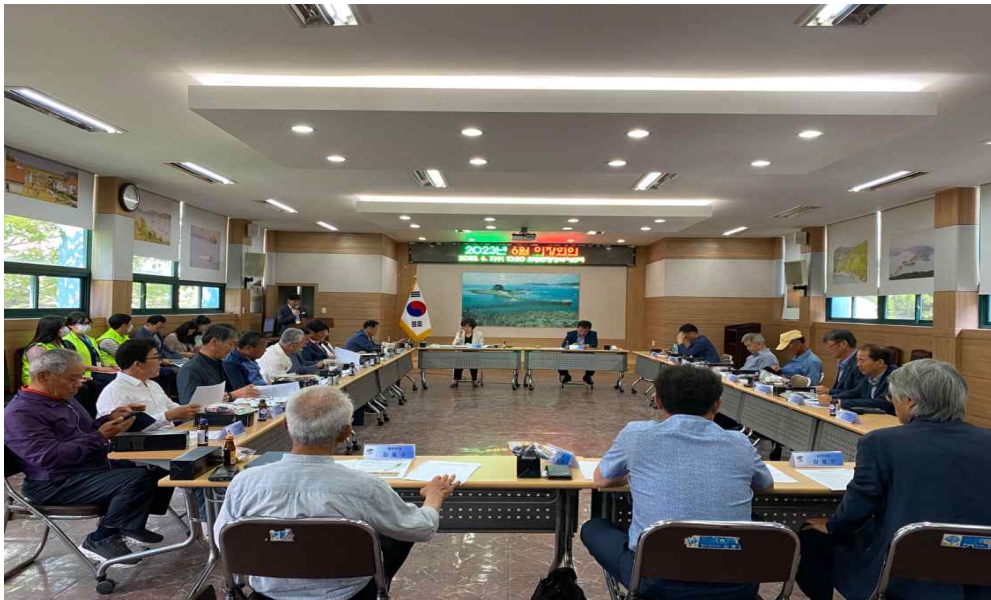
<6월 정례 이장회의>