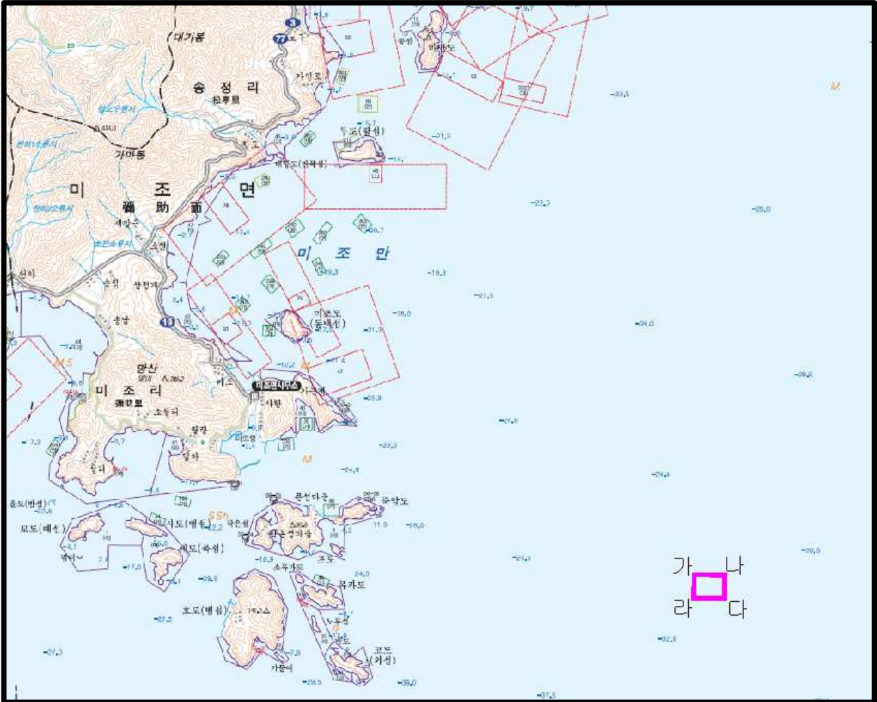
상기 도면에서 가,나,다,라를 순차로 연결한 선내 수역